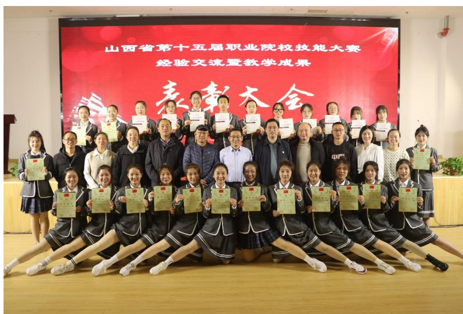
图 1-7 技能大赛获奖学生与指导老师合影