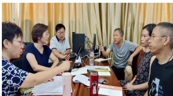
图 2-3 思政部、中文教学部教师讨论专业申报