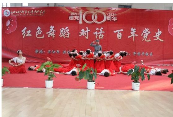
图 1-1 舞蹈系“红色舞蹈对话百年党史”活动

开展“一系一品”系列活动，极大地拓展了党史学习教育的深度、广度，增加了党史学习教育的厚度、亮度，《山西日报》报道了学校开展“一系一品”系列活动。