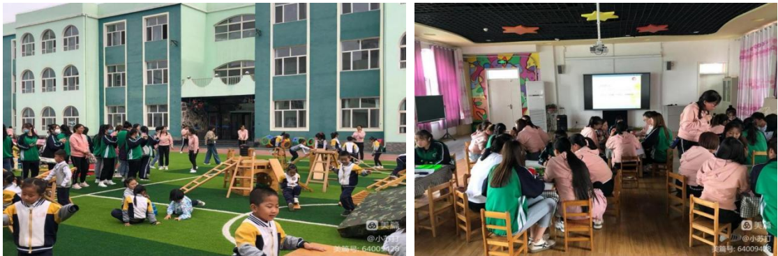
图 2-7 学前系学生在屯留区启智幼儿园开展实践教学

密”和“爱抱怨先生”示范课，参加教研活动，并与幼儿园一线教师共同设计游戏，此次观摩开阔了视野，增加了对幼儿园工作的感性认识，强化了职业认知，并在实操中对幼儿教育有了更加直观的认识，提升了自己的专业技能。