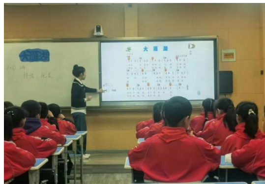
图 4-2 实习学生现场授课