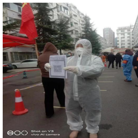
图 4-8 亮码引导居民进行核酸检测