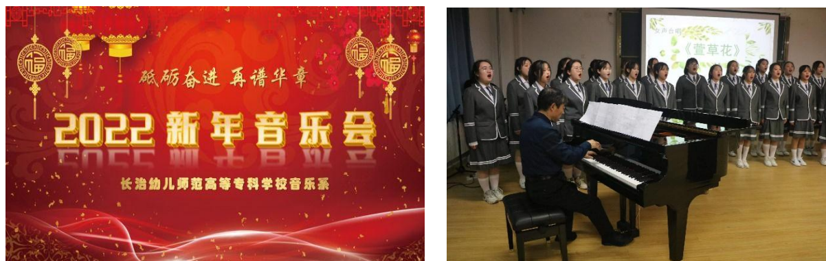
图 1-3 砥砺前行 再谱华章 2022 新年音乐会演唱现场