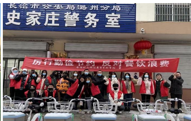
图 1-5 深入社区开展“光”盘行动