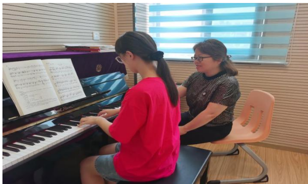
图 4-1 实习前教师现场指导