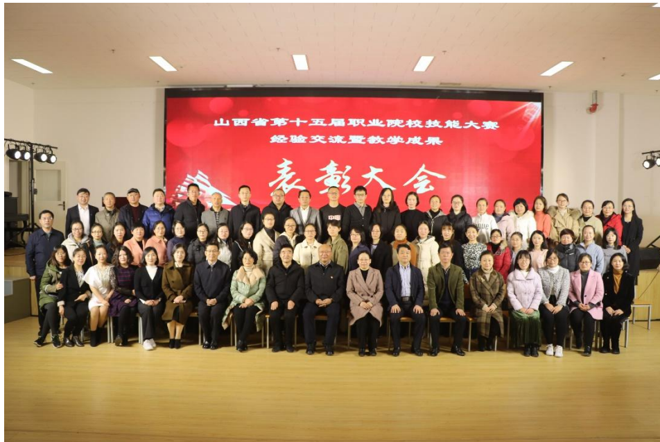
图 2-6 学校领导与参加省技能大赛的教师合影