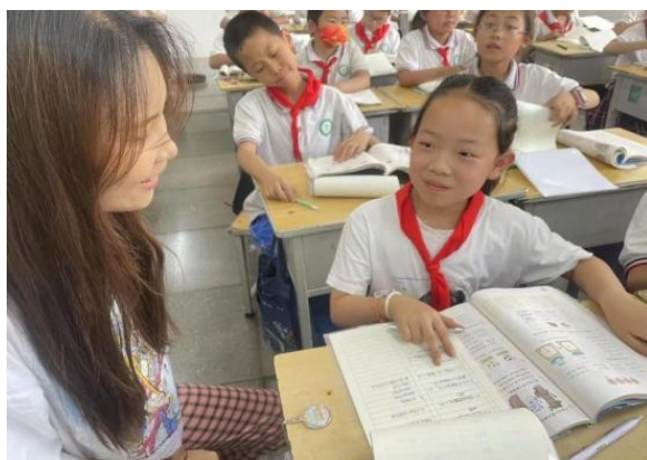
图 4-4 用心交流