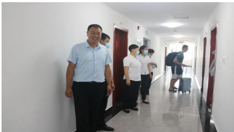
图 4-11 学校物业人员迎候参赛队员入驻