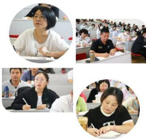
图 4-13 培训现场剪影

2022年8月10日至8月17日，长治市义务教育《课程方案》《课程标准》（2022年版）培训在学校进行，市直义务教育阶段各学校、学科教师及各县区教研室教研员参加了培训。为做好此次培训的服务工作，学校就对外联系协调、疫情防控、报到组织、培训现场服务、午餐供应、住宿保障、培训与专家接送、宣传报道进行了周到细致的安排。培训地点设在宽敞明亮的阶梯教室，参训人员午餐地点设在教工餐厅，菜品丰富、美味可口、卫生健康；午休设置在可接待300人的培训基地，提供中央空调和24小时热水服务。一流的办学设施设备、一流的服务质量，给专家和参训人员留下了深刻印象，也为这次培训的成功举办奠定了坚实的基础。