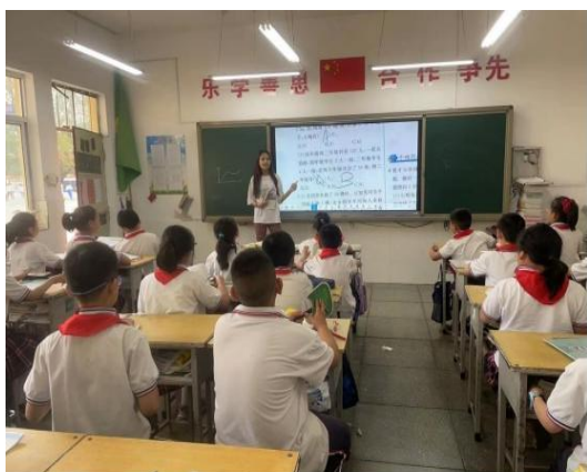
图 4-3 用心从教