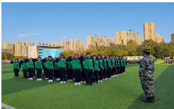
图 1-4 2021 级新生军训