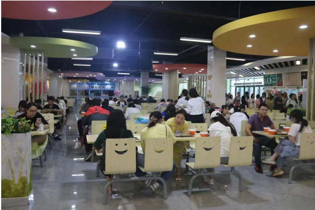
图 4-14 培训教师在餐厅就餐