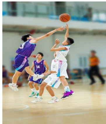
图 4-12 比赛现场