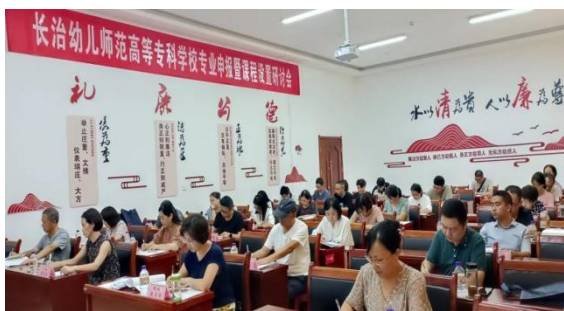
图 2-2 专业申报暨专业设置研讨会现场